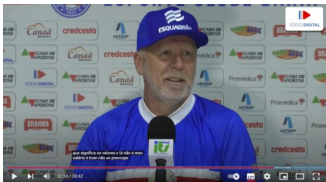
Figura 5 - “Meu salário é bom, não se preocupe”

tenham se dado em tom de descontração, indicam também que há uma certa relutância por parte de Mano Menezes em interagir com a imprensa.