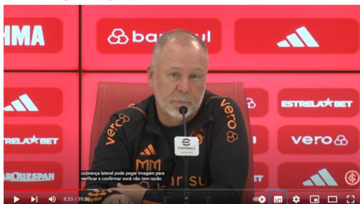
Figura 7 - “Pode pegar a imagem para verificar confirmar para ver se eu não tenho razão”

Nessa entrevista, ao contrário do observado nas anteriores, o treinador não responde às perguntas olhando para os repórteres, aparece desviando o olhar em diversos momentos, além de não as responder na totalidade e não desenvolver o seu pensamento, o que era fortemente percebido principalmente a partir de 2020 (Bahia). Além disso, nessa coletiva, dá respostas mais ríspidas aos jornalistas em comparação às anteriores. Observa-se isso quando questionado sobre o gol do América MG, que levou a partida para os pênaltis: “Pode pegar a imagem para verificar e confirmar para ver se eu não tenho razão” (Entrevista [...], 2023) – Figura 7.