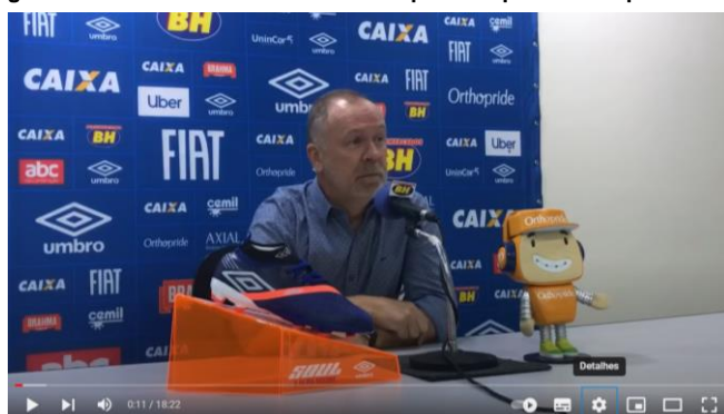
Figura 9 - Vestimenta social em coletiva pós conquista da Copa do Brasil

Essa impessoalidade em relação à torcida é apresentada em outra coletiva realizada durante a passagem pelo Cruzeiro, em partida após a conquista da Copa do Brasil em 2018. O treinador aparece com uma camisa social azul, conforme Figura 9. A cor da vestimenta representa as cores do clube, porém não o identifica claramente (por meio de logomarcas, brasões). Nota-se, portanto, que há a preocupação identitária com a entidade, porém, a partir de um certo distanciamento da figura do torcedor, mesmo após a conquista de um título, momento em que seria estratégico uma maior aproximação do torcedor.