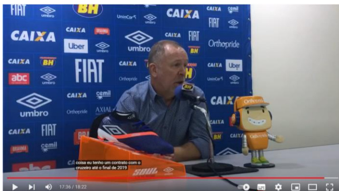
Figura 4 - “Eu tenho contrato com o Cruzeiro até o final de 2019”

O terceiro momento de visível desconforto com a pergunta realizada é justificado quando o treinador é questionado a respeito de sua permanência no Clube. O repórter deseja que Mano Menezes confirme que irá permanecer. O treinador diz “Eu tenho contrato com o Cruzeiro até o final de 2019. Foi isso que respondi para Porto Alegre, para São Paulo, pra Bahia e para o Rio de Janeiro” ([Vitória] [...], 2018). Depois da resposta, pode-se ouvir ao fundo “segue o Mano” ([Vitória] [...], 2018). Dessa fala é possível obter duas percepções: a primeira de que Mano segue sendo com a mesma personalidade conhecida pela imprensa, e a segunda, de que irá permanecer no comando do Clube. O importante aqui é que, após esse comentário, o treinador segue dizendo “Quem tem contrato, quer ficar [trazendo certo ar de obviedade]. Se acontecer alguma coisa diferente disso, a gente vai falar. Mas quem assina contrato quer ficar” ([Vitória] [...], 2018).