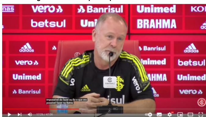
Figura 6 - “Eu fiz o que era possível fazer no Bahia”

impor limites e se defender. Quando questionado sobre sua passagem pelo Bahia, marcada por poucas vitórias e muitas polêmicas, respondeu: “Fiz o que era possível fazer no Bahia. No ano em que eu passei pelo Bahia, o Bahia teve três técnicos e teve 12 vitórias. 6 comigo. [...] Quando se avalia o trabalho de alguém, é importante a gente contextualizar” (Entrevista [...], 2022) – Figura 6.